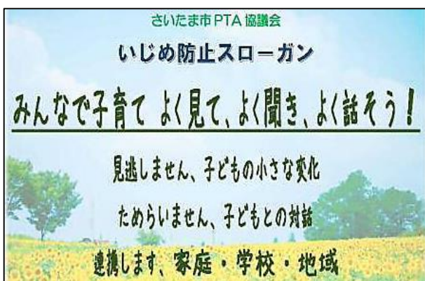
平成27年度「いじめ防止シンポジウム」発表